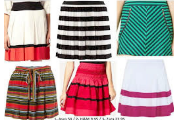
1- Asos 58 / 2- H&M 9,95 / 3- Zara 22,95 4- Topshop 522 / 5- Asos 147 / 6- Blanco 11,49